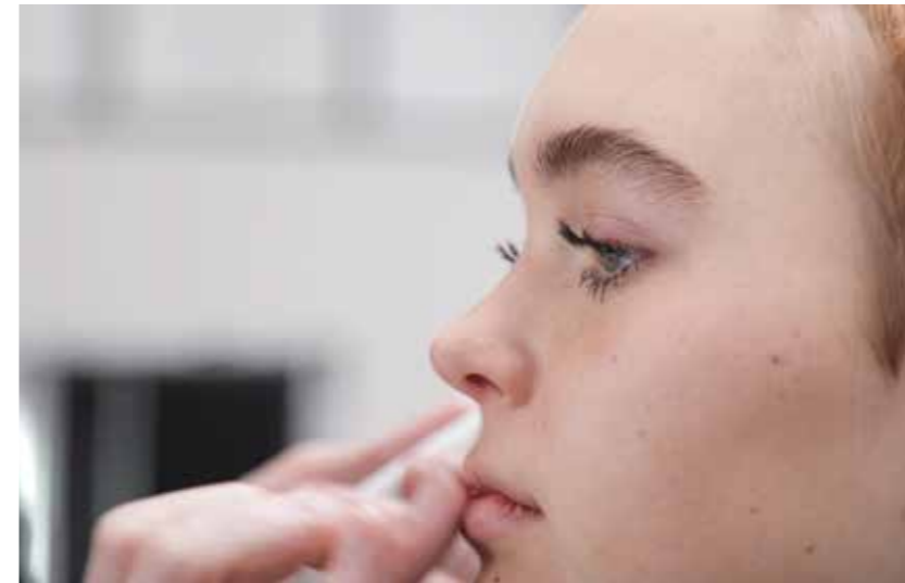
SANFT UND SUBTIL Ein Hauch von Farbe und Glow.

« In dieser Kollektion feiern wir die wahre Selbstliebe. Neben Natürlichkeit betonen wir Charakter, Individualität und Persönlichkeit. Die Haarschnitte und Haarstylings sind Ausdruck für unser Wohlbefinden. Auf absolut authentische und inspirierende Weise unterstützen und verstärken sie die natürliche Schönheit und das Selbstbewusstsein der unterschiedlichen Charaktere. »