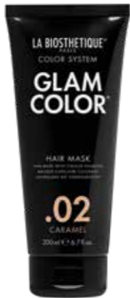
HOME CARE: Glam Color Hair Mask .02 Caramel