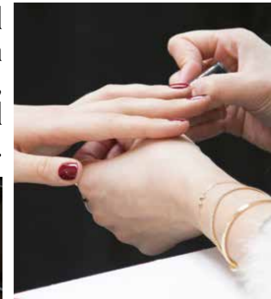
STARKES STATEMENT Die Anziehungskraft des tiefroten Nagellacks.