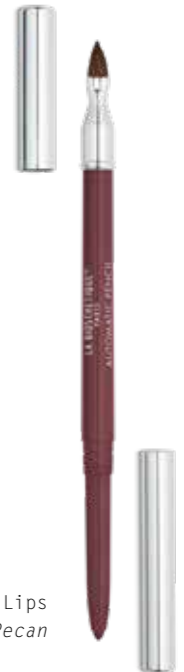
Automatic Pencil for Lips LL38 Pecan