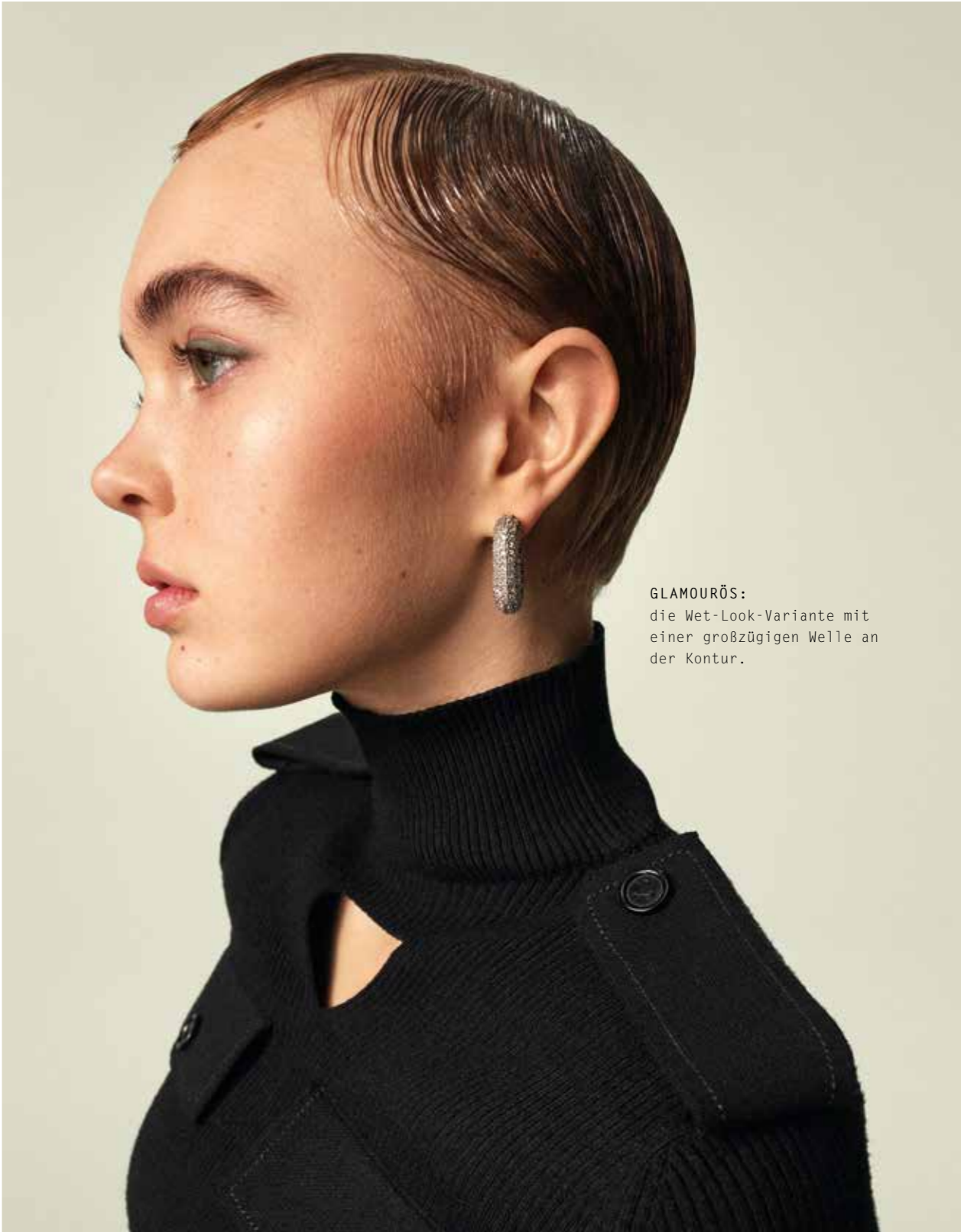
GLAMOURÖS: die Wet-Look-Variante mit einer großzügigen Welle an der Kontur.