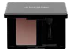
Magic Shadow 51 Pale Mauve

Magic Shadow 51 Pale Mauve umspielt den Blick und unterstreicht die souveräne, in sich ruhende Präsenz des Looks.