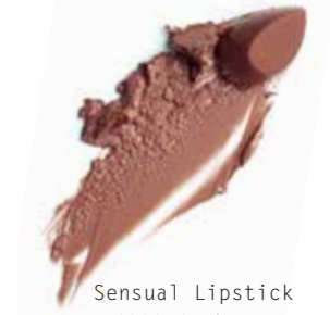
Sensual Lipstick G333 Cashmere