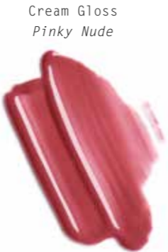
Cream Gloss Pinky Nude

Charakterkopf. Harmonisch unkonventionell: Unterschiedlich geschnittene Längen am Oberkopf erzeugen eine weiche Form, die durch warme Blond-Karamell-Nuancen unterstützt wird. Die Glam Color Haarmaske frischt den Glow der Haarfarbe ganz einfach zuhause wieder auf, sodass sie mit dem Make-up in durchscheinenden, schimmernden und glossigen Rosétönen um die Wette strahlt.